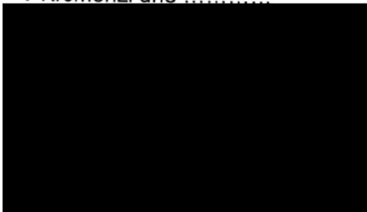
Mgr. Jaroslav Němec starosta města Kroměříž