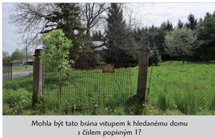
Mohla být tato brána vstupem k hledanému domu s číslem popisným 1?

indikační skici