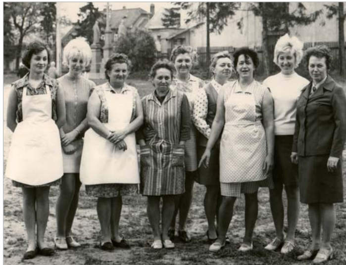
Školní rok 1971/72 - DM a ŠJ v Chropyni

Smích. „Tak, asi si to hoši řekli mezi sebou a nemusela jsem to dělat často.“