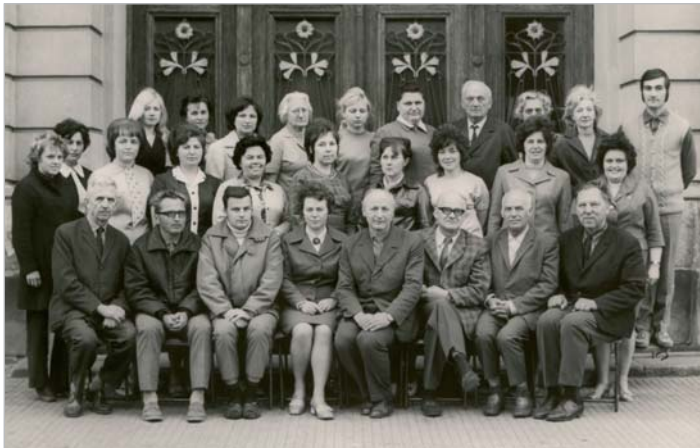
Školní rok 1971/72 - ZDŠ v Chropyni