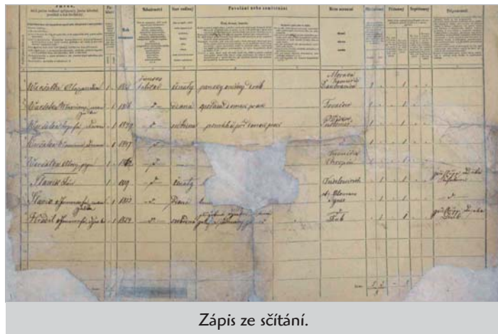
Zápis ze sčítání.