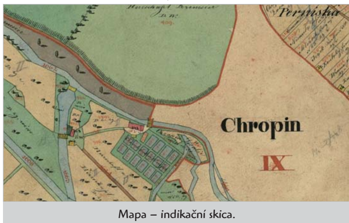
Mapa – indikační skica.

První mapa městečka, která je podrobná natolik, že zobrazuje i rozložení jednotlivých domů, pochází z prvního vojenského mapování z roku 1764–1783. Jako základ byly použity Müllerovy mapy. Důstojníci vojenské topografické služby měli projíždět zemí na koni a mapovat terén, odhadovali vzdálenosti, takže přesné tyto mapy rozhodně nebyly. Navíc domy nejsou očíslovány, takže hledanou informaci stejně nezískáme. Je nutné posunout se k dalšímu zdroji. Druhé vojenské mapování pochází z let 1836–1852 a pracovalo již s trojúhelníkovou sítí, jsou zaznamenány i nadmořské výšky významných bodů. Vytvořené mapy byly již mnohem přesnější. Ovšem ani na téhle mapě nejsou uvedena čísla popisná. V digitálním archivu jsou dostupné i identifikační skici. Ta nejstarší, která zachycuje Chropyni, je z roku 1830. V rozkreslených domech na náměstí a kolem cesty jsem náš hledaný dům čp. 1 nenašla. Při bližším zkoumání jsem si všimla, že mezi haltýři je zakreslena budova s naším postrádaným číslem. Skutečně začali v Chropyni označovat domy od haltýřů směrem k náměstí? Zdá se to hodně nezyklé.