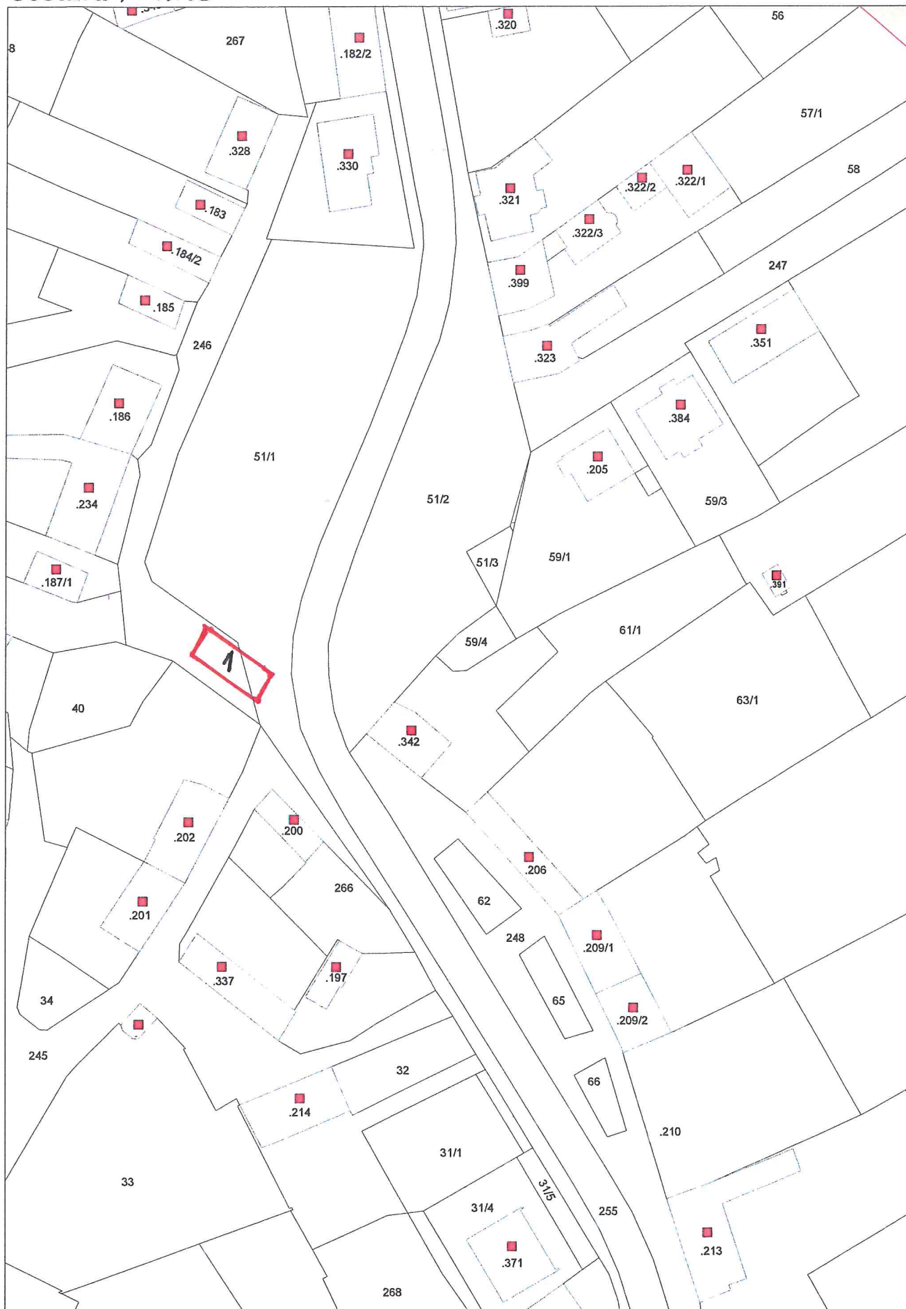
Mapa v měřítku 1:1000