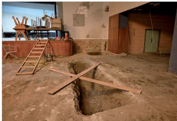
Práce na rekonstrukci Městského kulturního střediska mohou konečně začít.