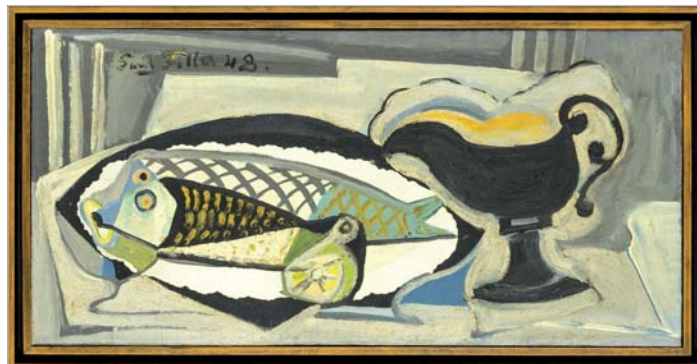
E. Filla: Zátíší s rybou a omáčkou, 1948, olej na plátně, 42,5 x 88 cm