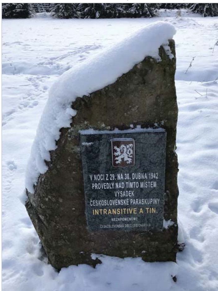
Pomník výsadku INTRANSITIVE v Brdech

V místech výsadku v Brdech se nachází pomník připomínající paraskupiny INTRANSITIVE a TIN. Tento pomník byl odhalen 17. června 2018 u chaty zvané „Václavka“ nedaleko Hořejšího Padrtského rybníka.